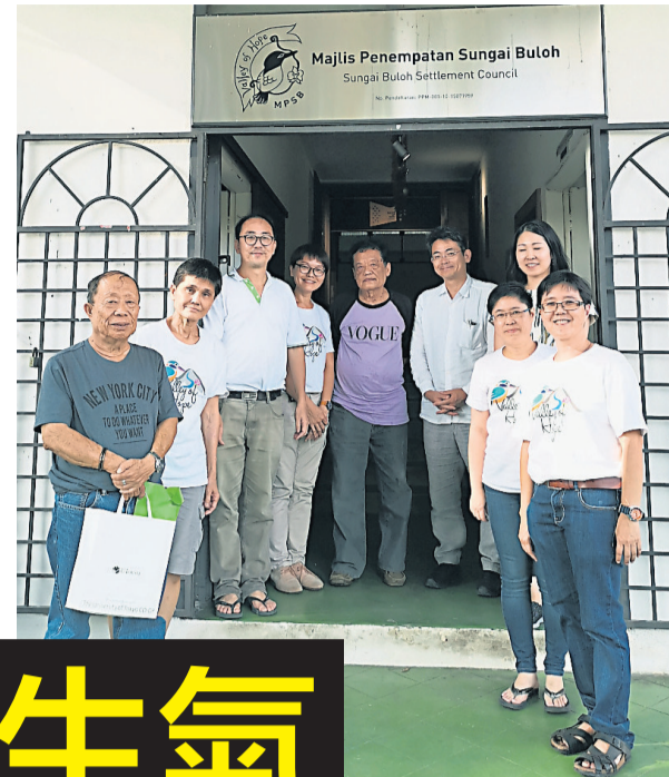
Otsuki 教授和參事會理事及義工合影。