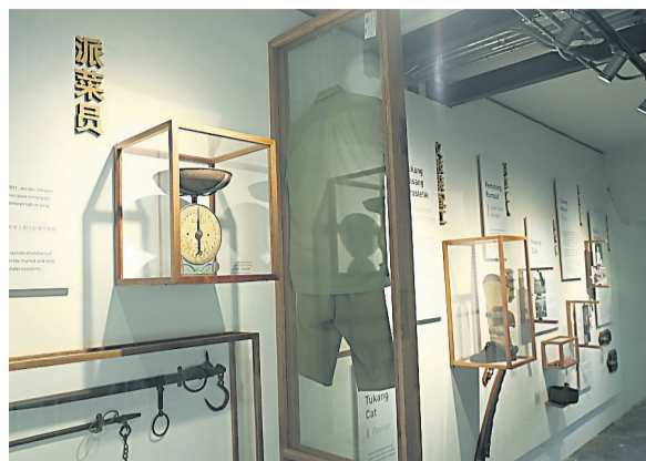
職業展區可看到各院民擔當的工作及他們使用過的各种工作配備。