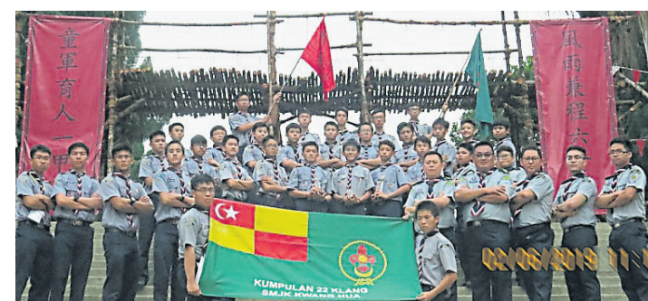
巴生光華國中男童軍團在“童城”全國男女童軍競技邀請賽暨營火會中表現優異。