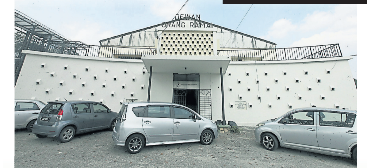
希望之谷故事館設於民眾禮堂內, 是記錄、收藏和展覽麻瘋病院社區集體記憶的地方。