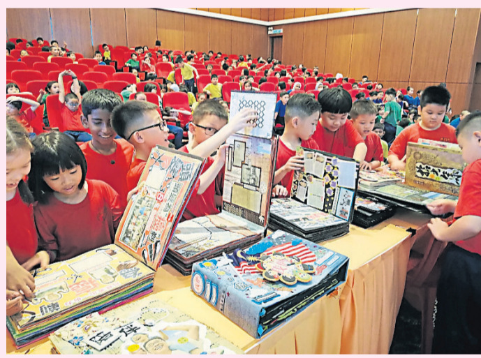
精美剪報專輯讓學生愛不釋手。