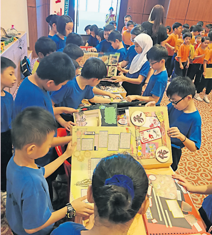
學生們仔細翻閱得獎專輯。