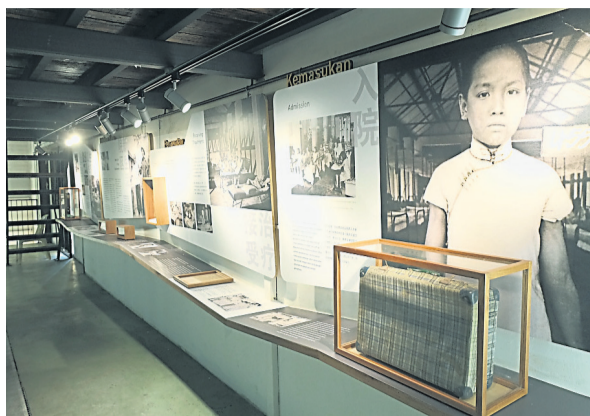
一樓展出院民入院後的生活概況和感人的生命線。