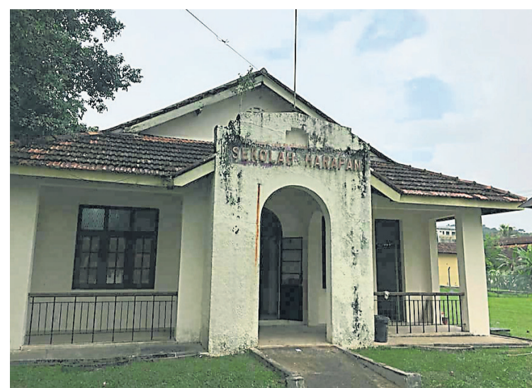
希望之谷艺术馆舍建筑为以前的特拉维斯学校。